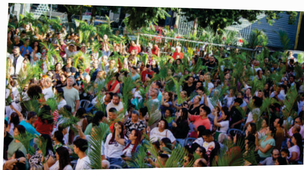
29/03 - Domingo de Ramos

APONTE A CÂMERA DO SEU CELULAR PARA O QR CODE E CONFIRA AS FOTOS DAS CELEBRAÇÕES NAS PARÓQUIAS