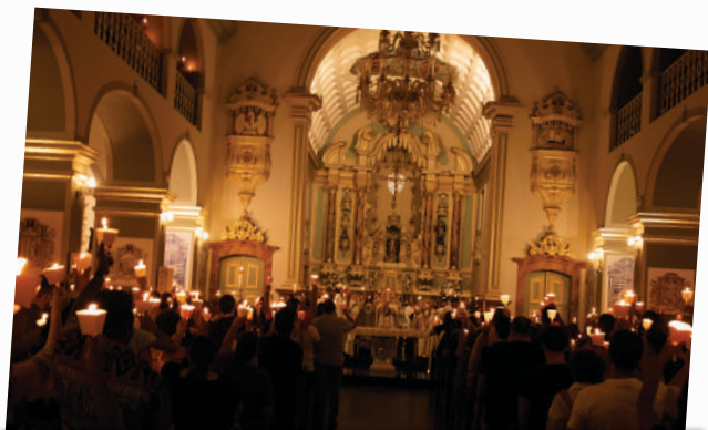
04/04 - Vigília Pascal