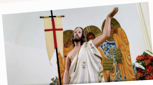
05/04 - Domingo da Páscoa na Ressurreição do Senhor