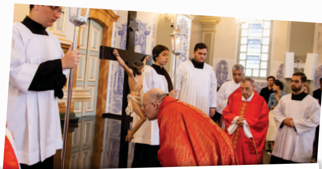
03/04 - Celebração da Paixão do Senhor