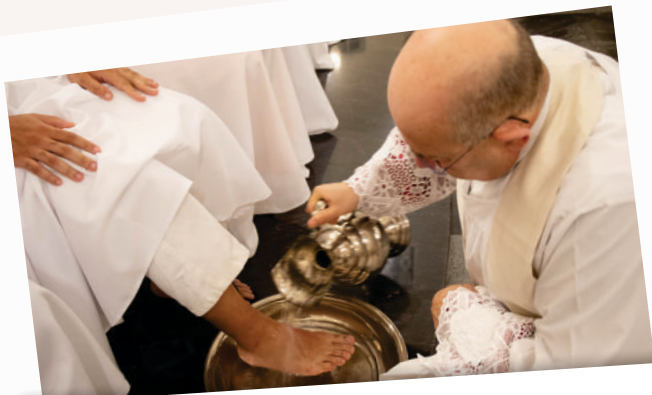
02/04 - Missa da Ceia do Senhor Lava-Pés