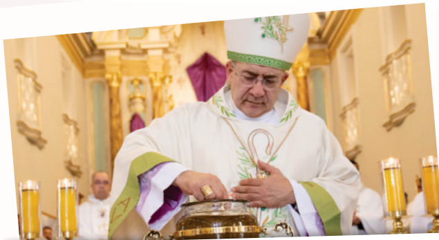
02/04 - Missa do Crisma Bênção dos Santos Óleos