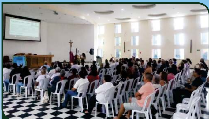
01/02 - Grupos de Rua