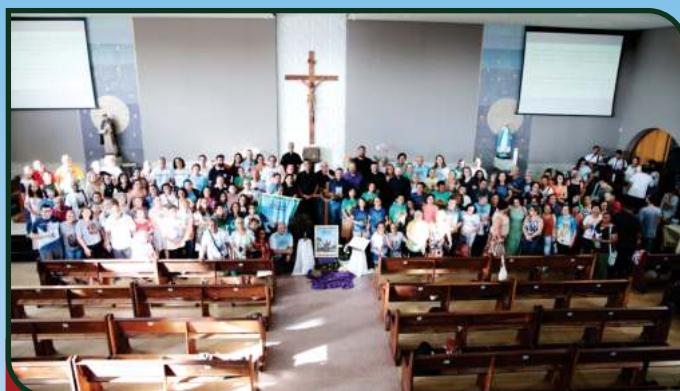
08/02 - Forania Bonsucesso