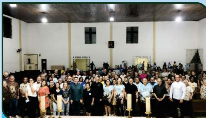
13/02 - Forania Imaculada